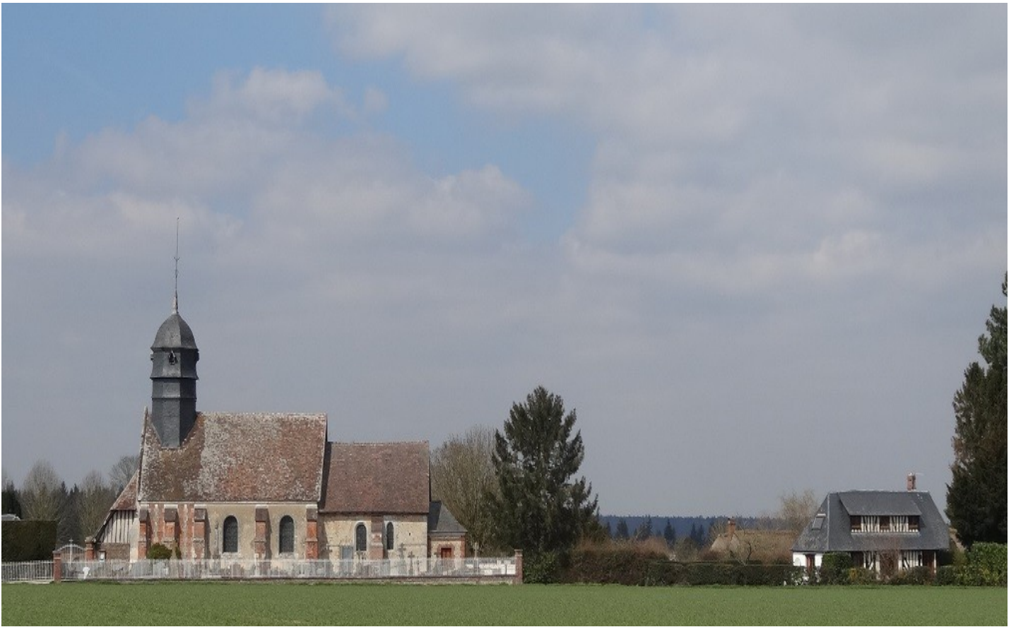
Photographie du monument historique